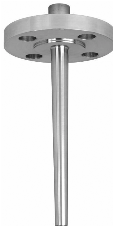
法兰式保护护套，型号 SI450F