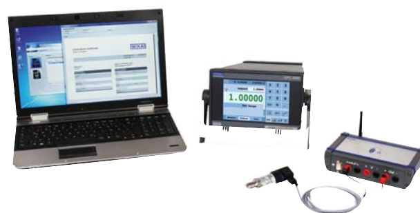
WIKa-Cal с пневматическим калибратором модели CPC3000 и датчиком давления с CalibratorUnit модели CPU6000-M

Более подробная информация о различных пневматических калибраторах приведена в типовых листах СТ 27.40, СТ 27.55, СТ 27.61, СТ 27.62 и СТ 28.01