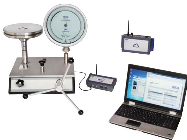
Модели CPU6000-W, CPU6000-S, CPB5800 и ПК с программным обеспечением Wika-Cal

С помощью калибратора модели CPN7000 можно загружать результаты тестирования выключателей из прибора и заносить их в протокол через Wika-Cal. Данное тестирование выключателей функционально доступно только для CPN7000.